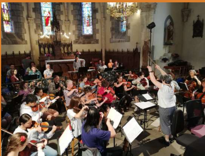
Conservatoire d'Aurillac. Avril 2023 (Premières séances de travail)